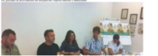
Posidonia Festival 2015 in questo

Salvatore Agri, salvatore.agri@comune.cagliari.it 22 giugno 2015, 16:56 Un giorno di discussioni all'Isola del Capricorno e ambientati